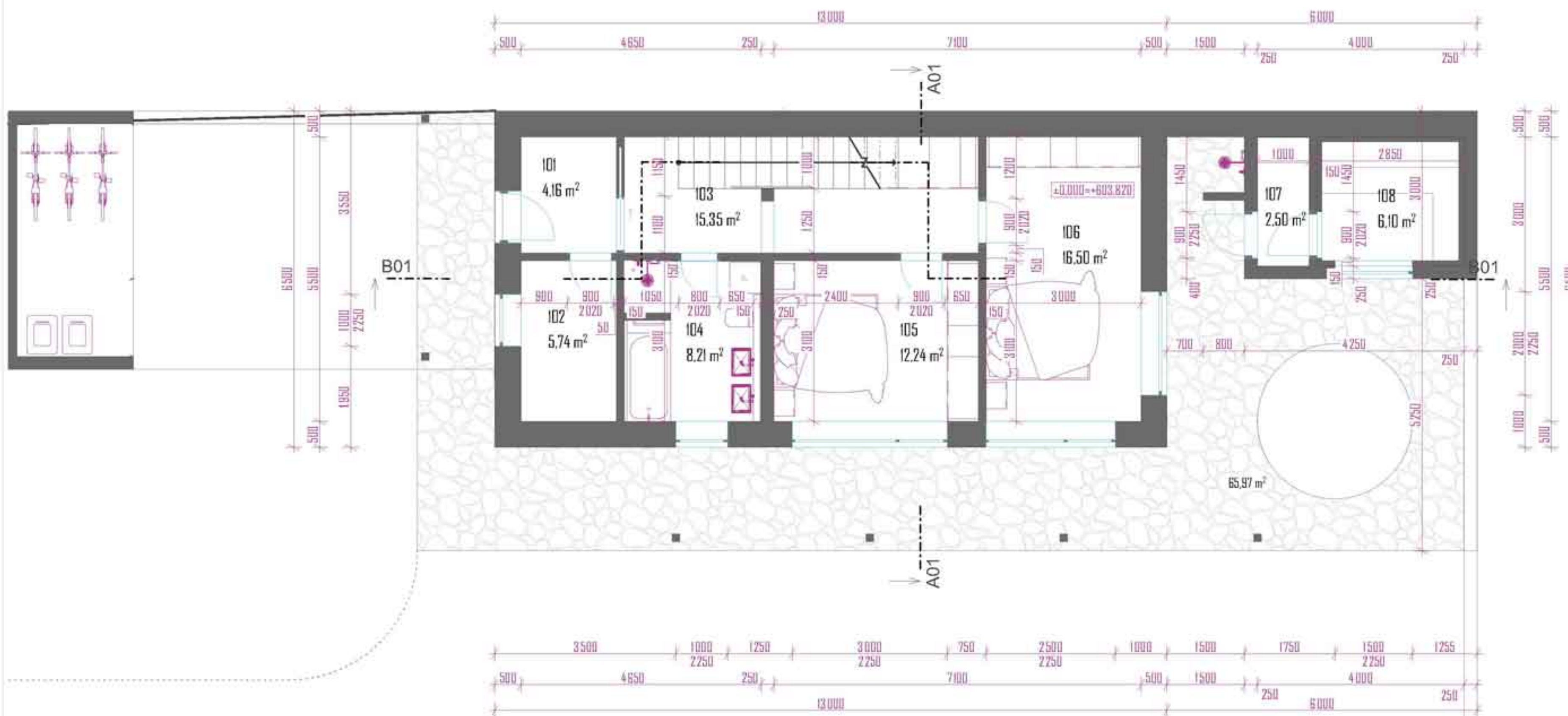
TABULKA MÍSTNOSTÍ I.NP (DŮM 01)