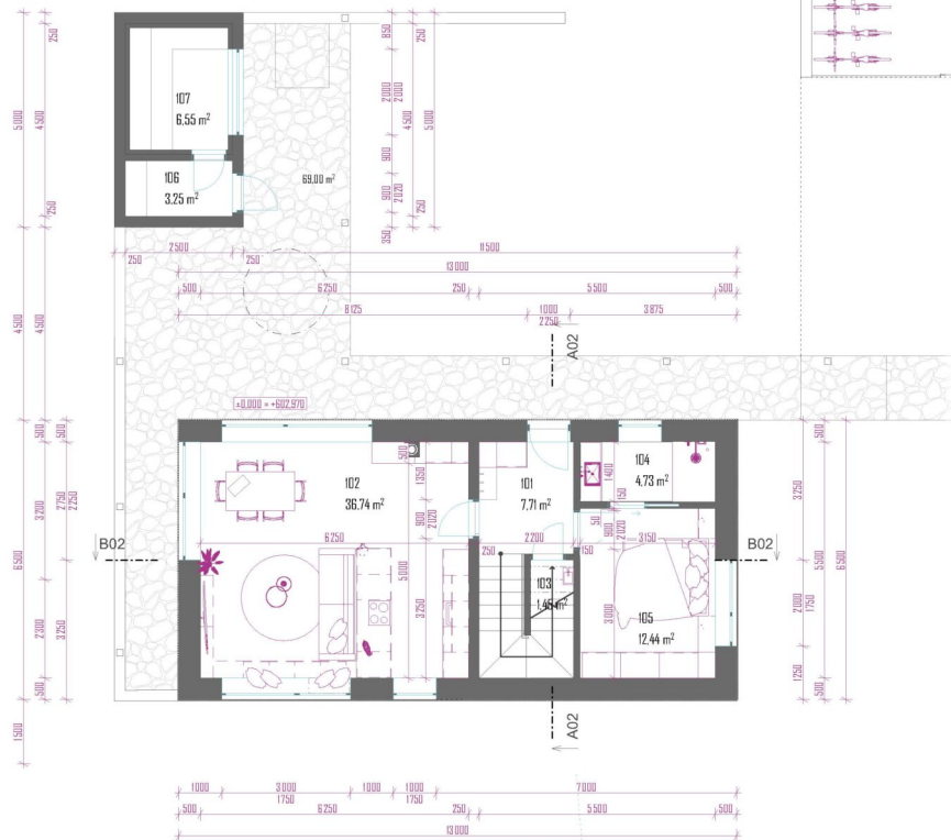
TABULKA MÍSTNOSTÍ I.N.P. (DŮM 02)